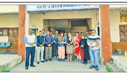
उचना। परिणाम में स्थान पाने वाले विद्यार्थी।