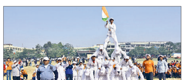
महाराजा सूरजमल जाट स्टेडियम में खेलों के शुभारंभ पर करतब दिखाते खिलाड़ी