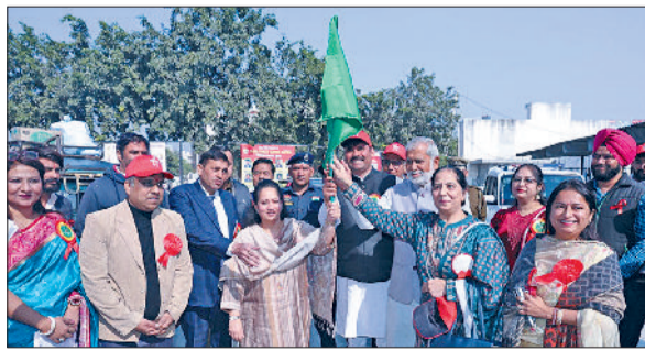
कैथल। स्वास्थ्य मंत्री आरती सिंह राव जागरूकता रैली को हरी झंडी दिखाते।

प्रदेश की स्वास्थ्य मंत्री आरती सिंह राव ने कहा कि हरियाणा सरकार द्वारा एक सशक्त और संवेदनशील स्वास्थ्य ढांचा विकसित किया है, जिसकी गुणवत्ता से एचआईवी संक्रमित का हर संभव इलाज किया जा रहा है। हम सबको मिलकर भारत को एड्स मुक्त बनाया है, इसमें आमजन की सहभागिता बहुत जरूरी है। एचआईवी एड्स एक गंभीर बीमारी है। बीमारी को हराने के लिए जन-जन को जागरूक करना आवश्यक है। आरती सिंह राव