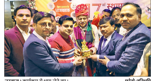
नरवाना। कार्यक्रम में भाग लेते हुए।