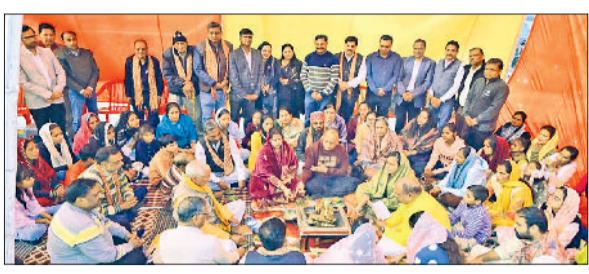
कैथल। हवन में आहुति डालते सदस्यगण।

श्री नरारायण सेवा समिति कैथल ने आज समाज सेवा की दिशा में महत्वपूर्ण कदम उठाते नवनिर्मित शिक्षा भवन का विधिवत लोकार्पण किया। भवन के बनने से अब झुग्गी-झोपड़ी क्षेत्र के वे बच्चे, जिन्हें पहले खूले में शिक्षा दी जा रही थी, छत के नीचे बेहतर सुविधाओं के साथ सम्मानजनक अध्ययन का अवसर प्राप्त होगा। समिति ने संचालित 13 केंद्रों पर सार्यकालीन सत्र में 754 बच्चों को फ्री शिक्षा प्रदान की जा रही है। नए भवन के निर्माण होने पर पंतनगर में 'माधव शिक्षा केंद्र' के बच्चों को सुरक्षित, स्थायी माहौल में शिक्षा दी जा सकेगी।